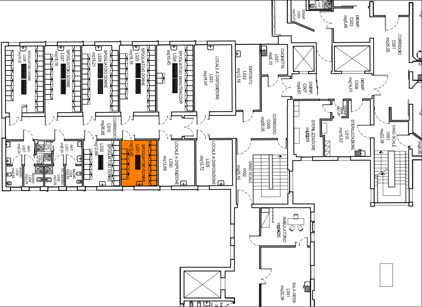
PIANTA PIANO SECONDO