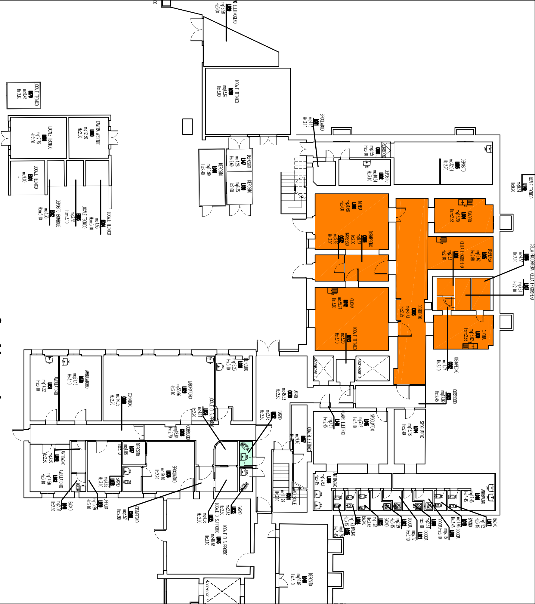
PIANTA PIANO INTERRATO